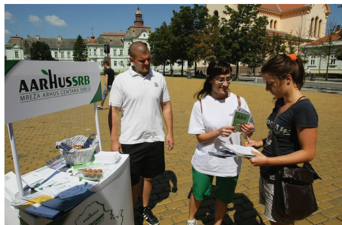
Volonteri iz mreže Arhus Centara objašnjavaju značaj primene Arhuske konvencije građanima na lokalnom nivou, Zrenjanin, Srbija.

Arhus centri su sve angažovaniji na regionalnom i međunarodnom nivou kroz zajedničke prekogranične aktivnosti i aktivno učešće na međunarodnim sastancima, u prekograničnim konsultacijama i procesima donošenja odluka.